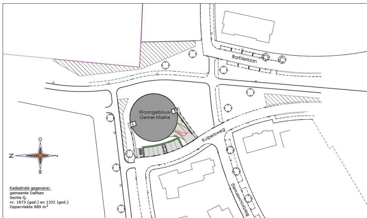
Situatieschets plaats woongebouw Gerner Marke.